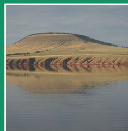
гора Удагтай, Осинский район