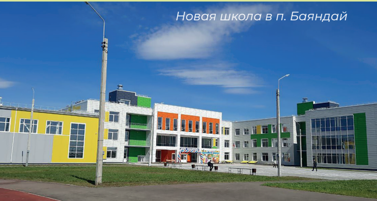
Новая школа в п. Баяндай

В 1958 году округ переименован в Усть-Ордынский Бурятский автономный округ