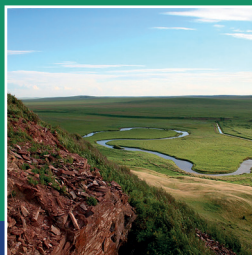
гора Манхай, Эхирит-Булагатский район