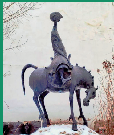
Скульптура «Усть-Орда» автор Даши Намдаков

Работают ГБПОУ Иркутской области «Боханский педагогический колледж им. Д. Банзарова», ГБПОУ Иркутской области «Боханский аграрный техникум», имеющий Осинский филиал ОГБПОУ «Усть-Ордынский медицинский колледж им. Шобогорова М.Ш.» и ГБПОУ Иркутской области Усть-ордынский аграрный техникум», филиал «Новонукутский» и «Учебно-производственное отделение» пос. Кутулик ГАПОУ Иркутской области «Заларинский аграрный техникум».