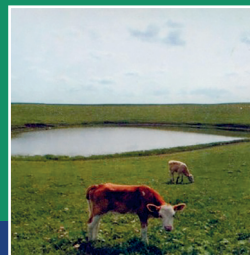
озеро Нуху-Нур, Баянгаевский район