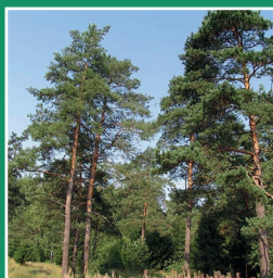
Баторова роща, Аларский район